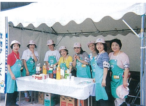
“ごず”がおいしかったです。