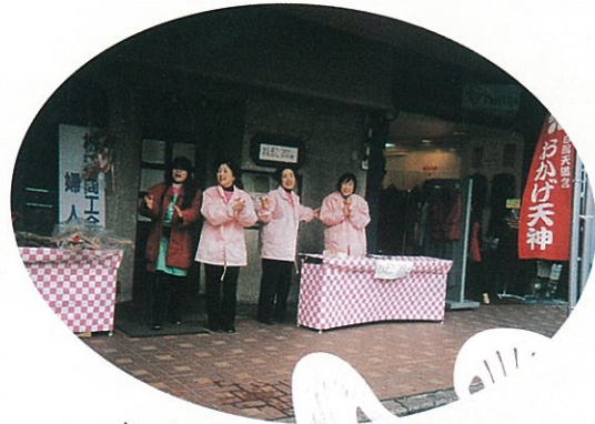
おいしいおしるこ、大繁盛!!