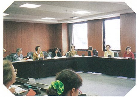
米子会議所との交流会