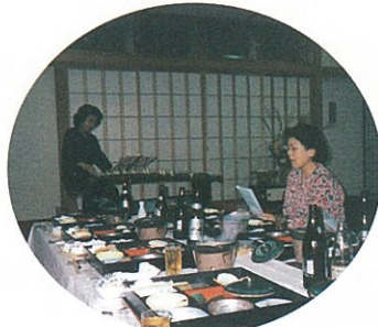
観月会 台風で延び延び。