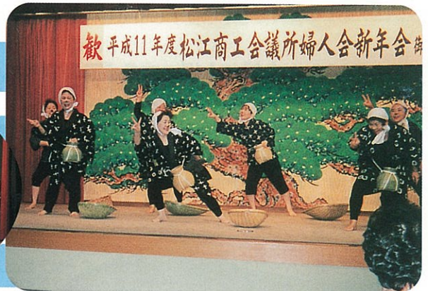
どじょうが美女達におべてにげてしまったがー。