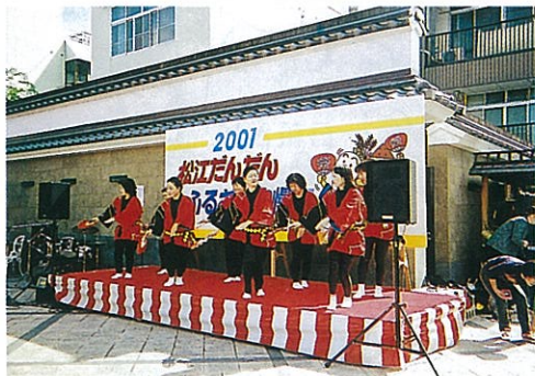
2001松江だんだん・ふるさと自慢市に参加して 於カラコロ広場