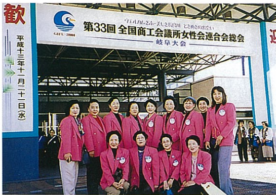
全国大会 岐阜大会