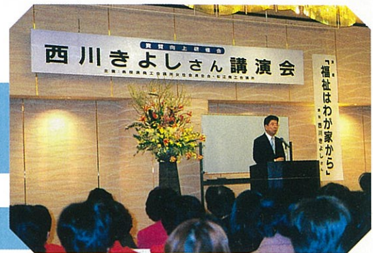
西川きよしさん講演会 ケアサービス“#8080”