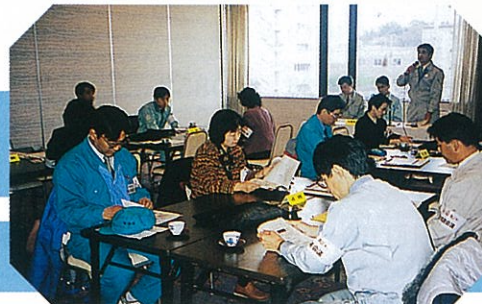
一日道路パトロール説明会 まじめに聞いています！