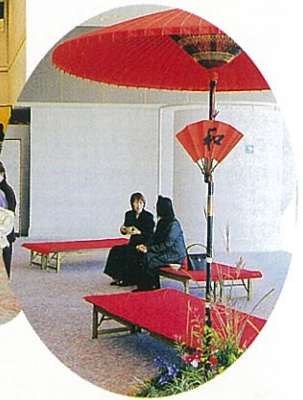
創立40周年記念式典 お茶でおもてなし