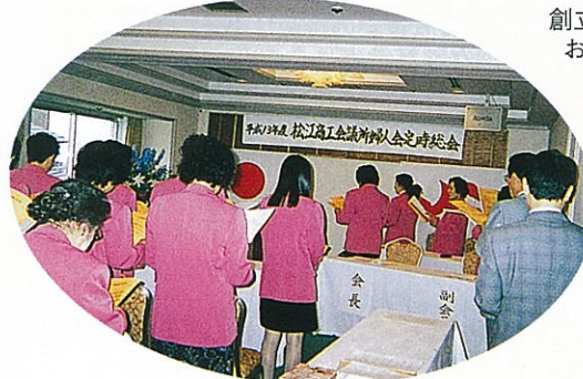
婦人会定時総会 於H一畑