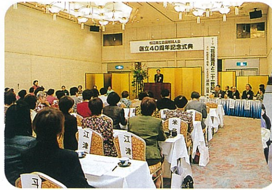
松江商工会議所女性会 創立40周年記念式典 於H一畑