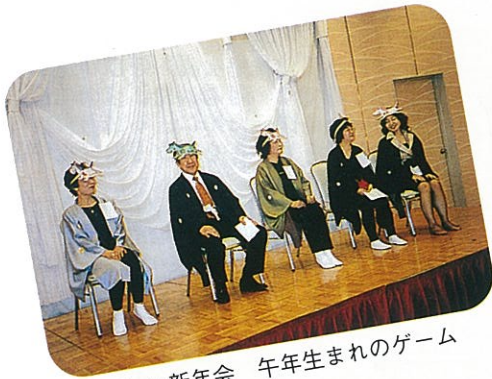
楽しい新年会 午年生まれのゲーム