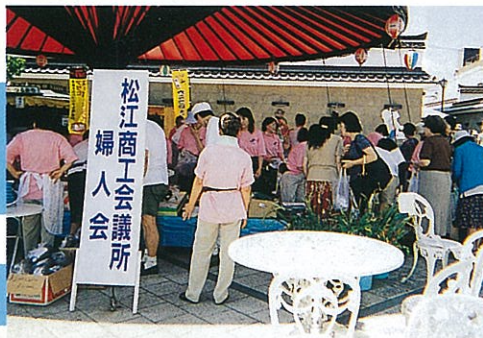
バザー よく売れました