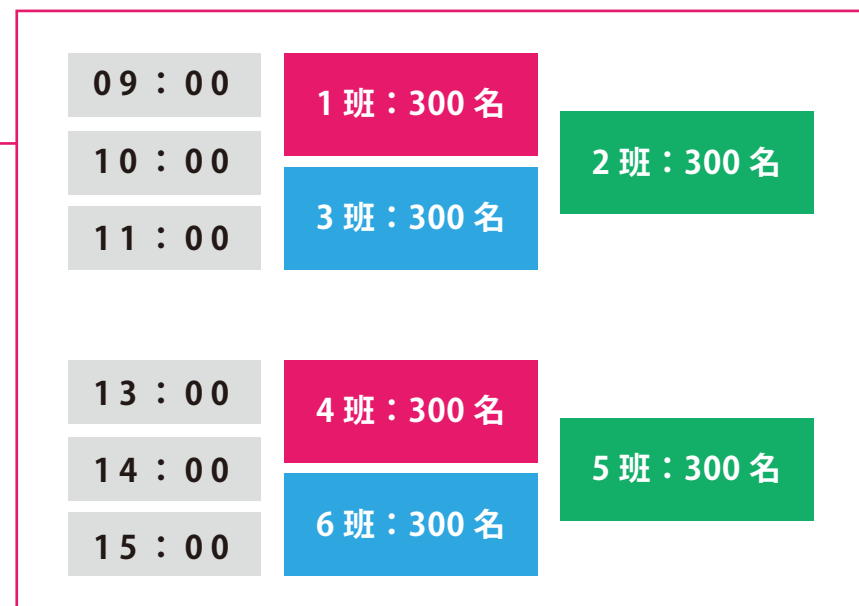
各班の会場入りスケジュール