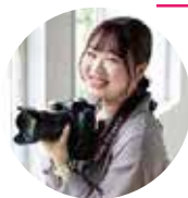
写真部：カメラマン (中途入社：5年目)