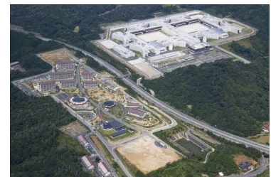
島根あさひ社会復帰促進 センター整備・運営事業 (法務省)