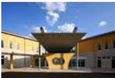
島根県立こころの医療センター 維持管理・運営事業 (島根県)