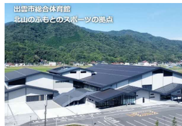
出雲市総合体育館 北山のふもとのスポーツの拠点 整備運営事業 (出雲市)